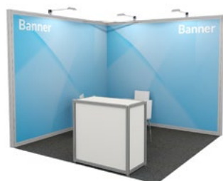
18 m 2 Beispiel